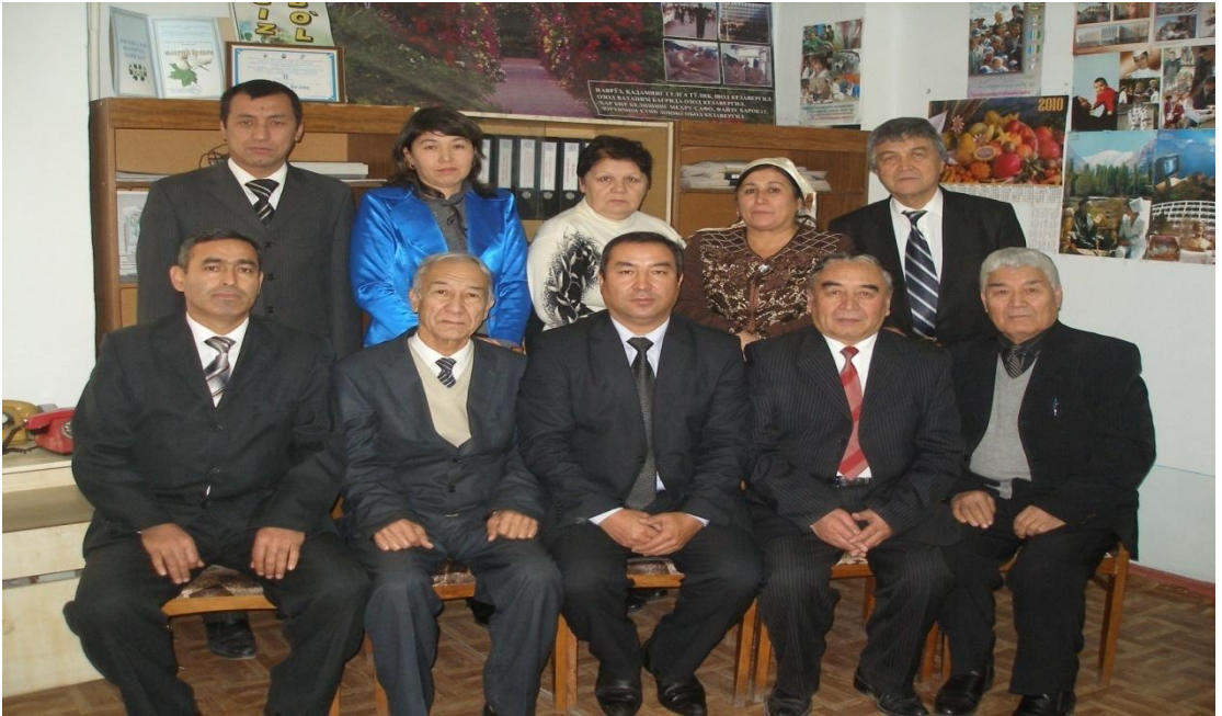
Kasaba uyushma faollari

1960 yildan boshlab Andijon Davlat tibbiyot instituti xodimlar kasaba uyushmasi qo'mitasi raisi lavozimida quyidagi professor-o'qituvchilar faoliyat yuritganlar: