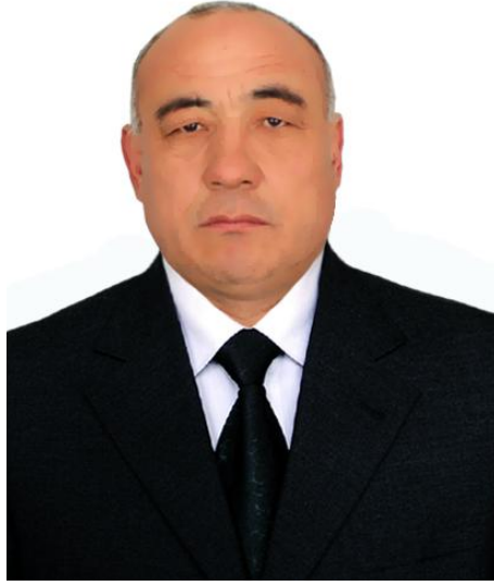
Xodimlar kasaba uyushma qo'mitasi raisi