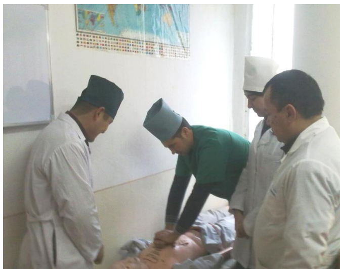
Yurak yopiq massaji