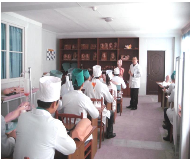
Amaliy ko'nikmalar laboratoriyasida