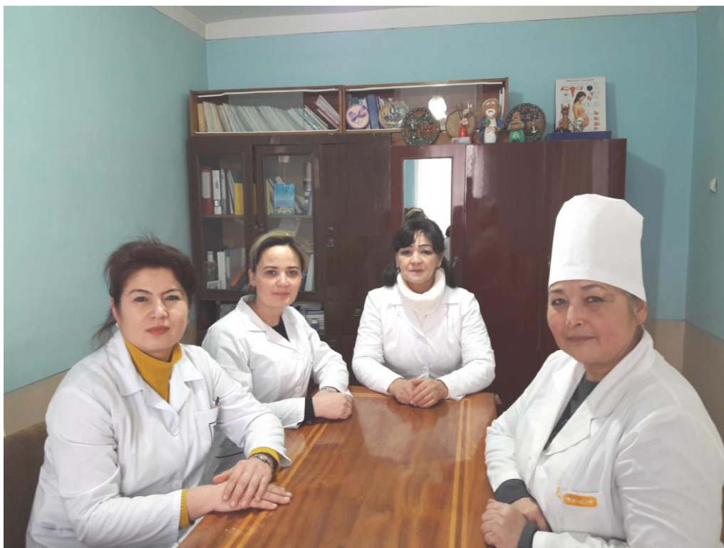
Kafedra jamoasi 2019 yil

Kafedra zamonaviy texnika vositalari bilan o'qitish uchun jihozlangan, ular: Videoikkilik; Kompyuter; Kodoskop; Multimedia; Nootbuk; Laminatsiyalangan ukuv plakatlari; Zoya; Akusherlik qisqichlari; Kursantlarga tug'ruk jarayonini olib borilishini ko'rsatish uchun tug'ruk zalida distantsion videokamera o'rnatilgan;