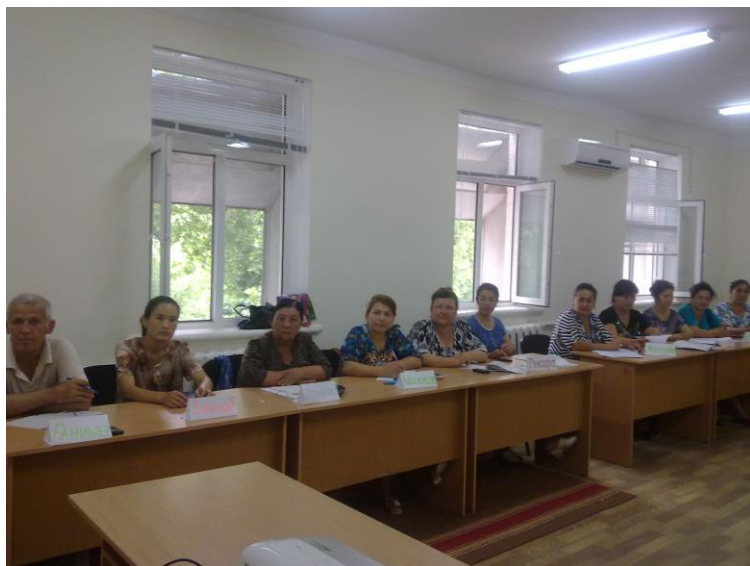
Фаргона шахридаги сайёр цикл

SHu yillar mobaynida 6000 tadan ortik mutaxassislar malakasini oshirib ketgan.