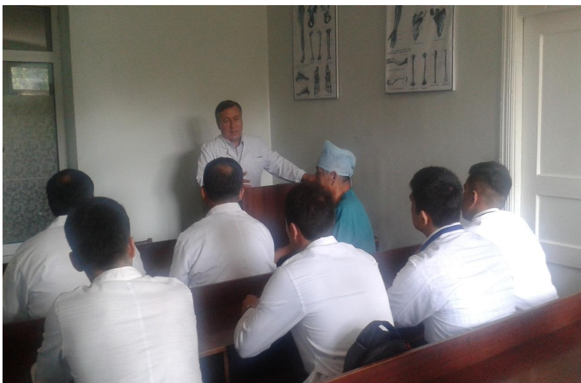
Tibbiy kuriklar va tumanlardagi ukuv muassasalarga taschriflar