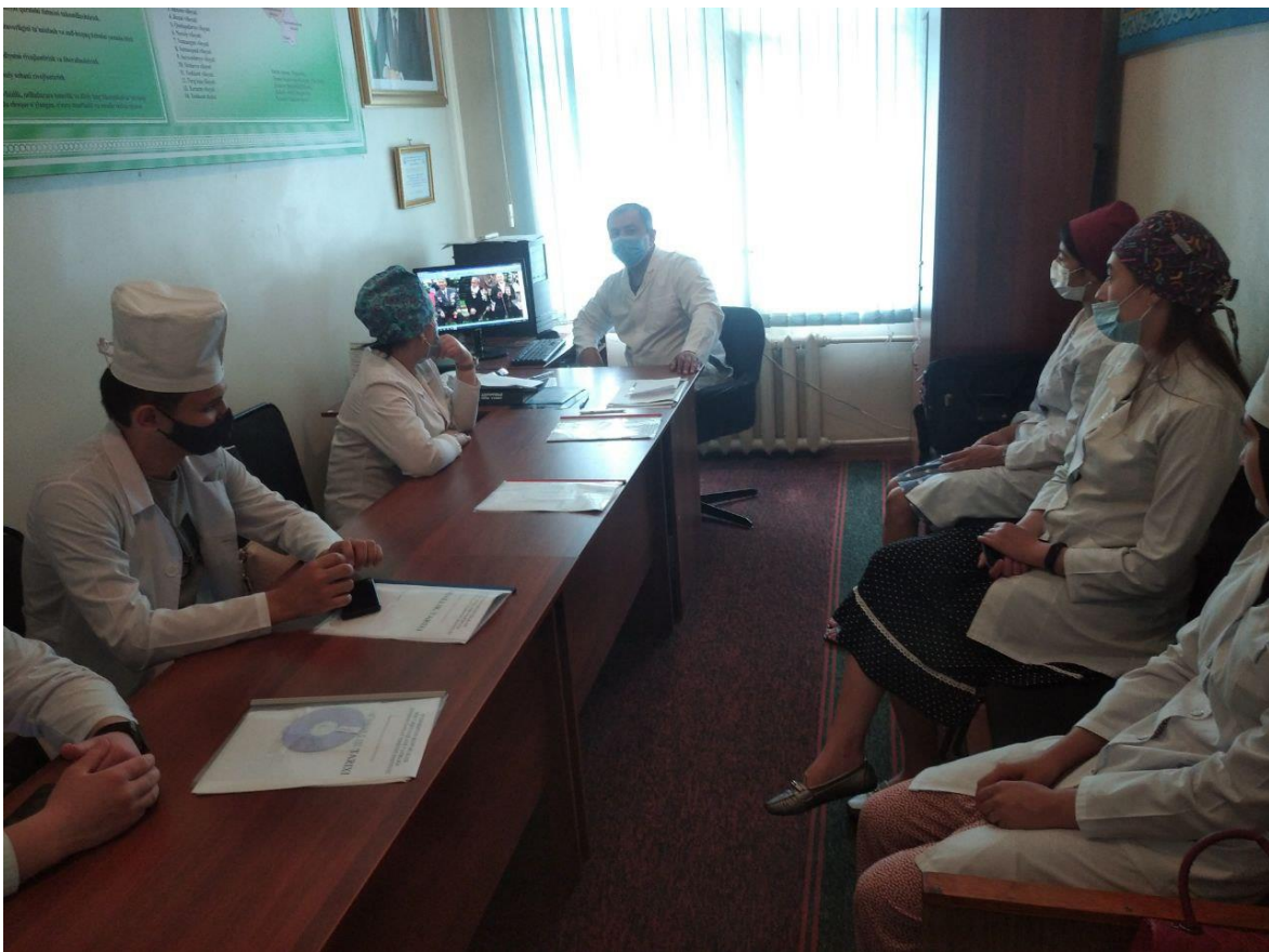
Hotira va Qadrlifsch