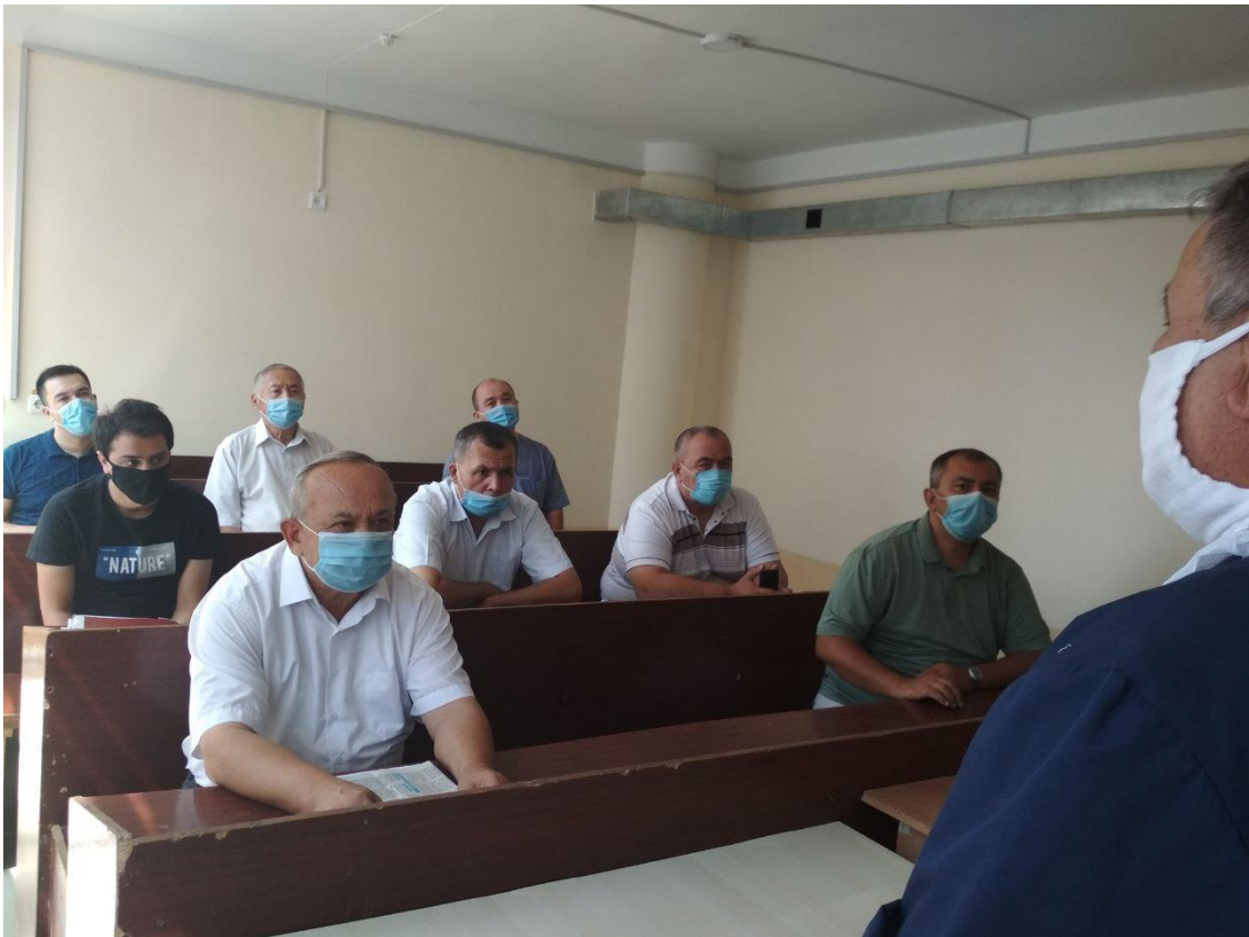
TTJda utkazilgan tadbirlar